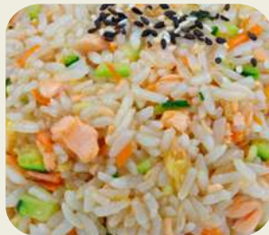
42 RISO SAKE riso con salmone saltato.