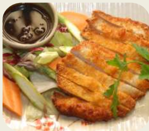
24 TONKATSU cotoletta di maiale impanato frita.