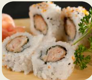
15 URAMAKI MIURA Philadelphia, salmone grigliato. 8pz