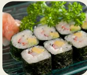
21 CALIFORNIA 8 PZ avocado, surimi di granchio e maionese.