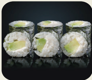
20 HOSSOMAKI PHILADELPHIA Philadelphia, avocado 8 pezzi