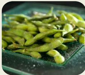
3 EDAMAME Fagiolini di soia. *