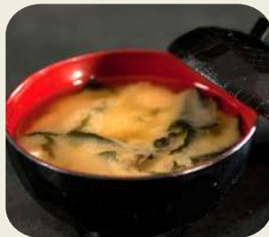
6 Zuppa Miso soia con alghe, erba cipollina.