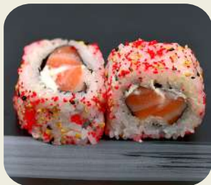
17 URAMAKI PHILADELPHIA Salmone con philadelphia. 8pz