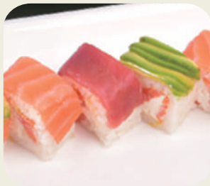
83 ROLL RAINBOW ROLL RAINBOW philadelphia, avocado e pesce misto