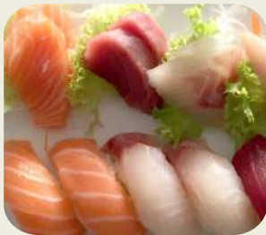
57 SUSHI SASHIMI MISTO 6 pz sushi, 9 fette sashimi.