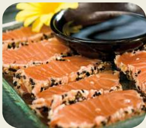
86 SAKE TATAKI Salmone scottato con sesamo.