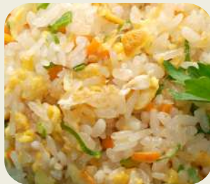
12 RISO VERDURE SALTATO