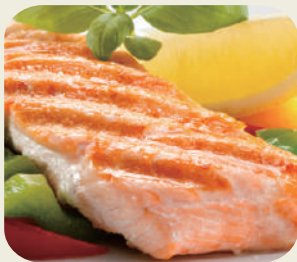
54 SALMONE GRIGLIA con salsa teriyaki