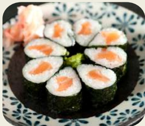
19 HOSSOMAKI SAKE Salmone 8pz