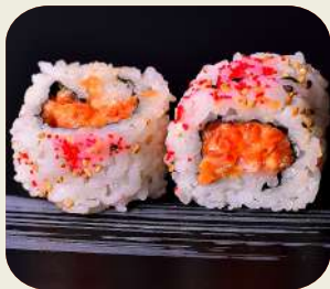
43 URAMAKI SPICY SAKE Salmone, cipollotti, tabasco, maionese. 8pz