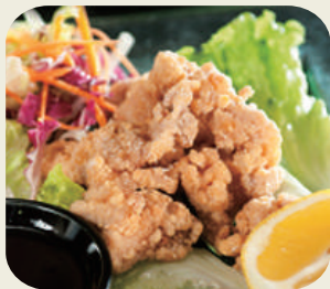
53 Pollo fritto