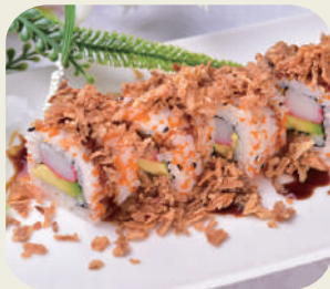
13 FRESH ROLL JIN Surimi avocado e maionese con cipolle fritte e salsa teriyaki 8PZ