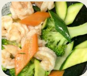
22 EBI YASAITAME verdura saltata mista con gamberetti.*