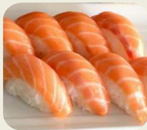
26 SUSHI SALMONE (8 pezzi)