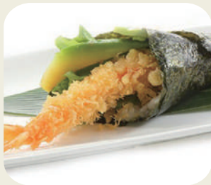
71 TEMAKI EBI TEN

Gamberone fritto avocado e maionese. 2pz *