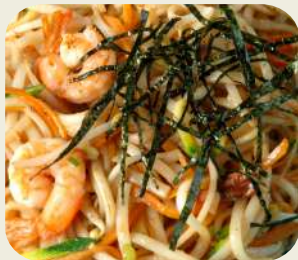
11 YAKI UDON pasta con gamberi e verdure saltate.