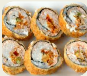
88 MAKI FRITTI Salmone, philadelphia, cipollotti, tobiko. 10 pz