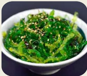
5 WAKAME VERDE insalata di alghe verdi leggermente piccante. *