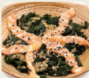
33 WAKAME con salmone