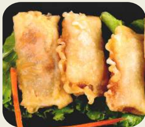
2 HARUMAKI involtino di salmone . 3pz *