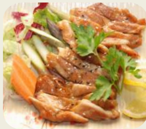
23 POLLO TERYAKI pollo alla griglia Con salsa teryaki.