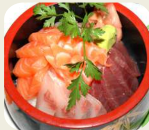
55 CHIRASHI MISTO salmone, tonno, pesce bianco.