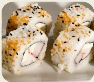
16 URAMAKI FLORIDA Philadelphia, surimi, gambero cotto. 8pz