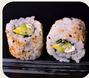
18 URAMAKI VEGETARIANO Avocado, cetriolo, insalata. 8pz