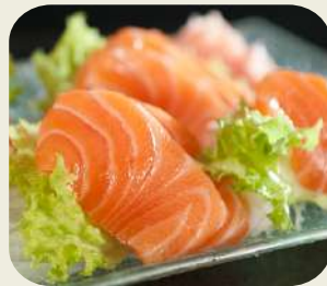
58 SASHIMI SAKE 12 fette salmone.