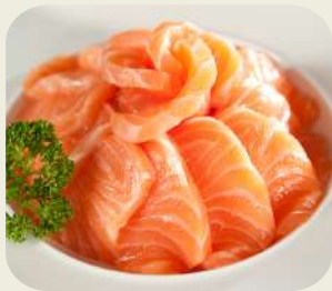
56 CHIRASHI SAKE salmone e riso con aceto.