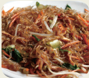
46 SPAGHETTI DI SOIA CON VERDURE