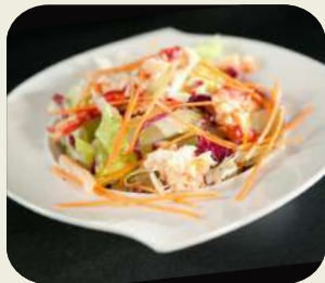
4 INSALATA MISTA