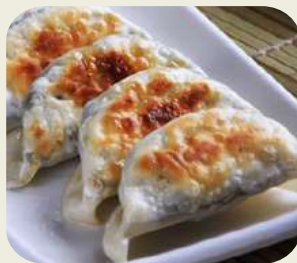
34 Gyoza 4PZ. Ravioli alla griglia con carne. *