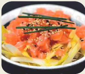
62 TARTARE DI SALMONE