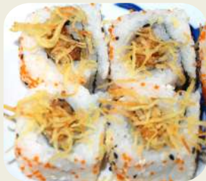
14 URAMAKI EBI TEN Gamberone fritto. * 8pz