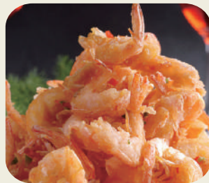
85 GAMBERI SALE PEPE