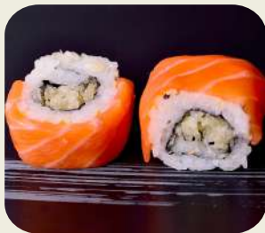
44 URAMAKI MIAMI Pastella di tempura con fette di salmone. 8pz