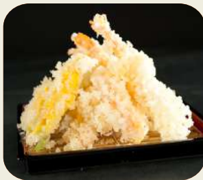
87 TEMPURA* Fritto misto di verdure e gamberi.