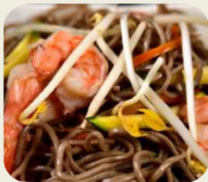
41 YAKI SOBA Spaghetti di grano saraceno, gamberi, verdure.