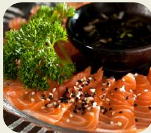
63 CARPACCIO DI SALMONE