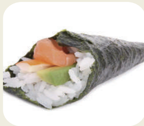
72 TEMAKI SAKE

Gamberone fritto avocado e maionese. 2pz *