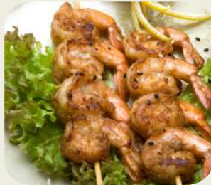
52 SPIEDINI DI GAMBERI ALLA GRIGLIA *