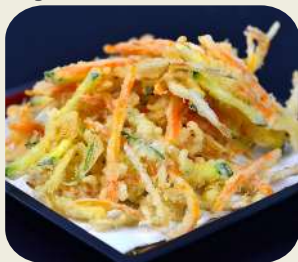
25 KAKI AGE verdure e gamberetti fritti.