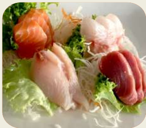
82 SASHIMI MIX 12 fette pesce misto crudo.