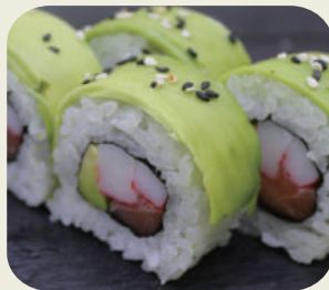
45 ACOVADO MAKI avocado, surimi e salmone